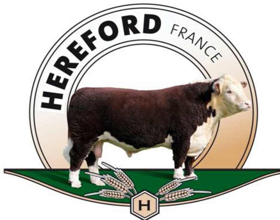
TABLEAU DES ÉLEVAGES MEMBRES DE L'OS HEREFORD FRANCE